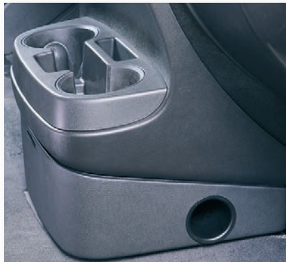
»65520-S« Subwoofer MiKo in der Mittelkonsole unter dem Getränkehalter im Fiat Ducato