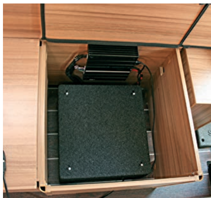
»17011« Subwoofer unter dem Sitz