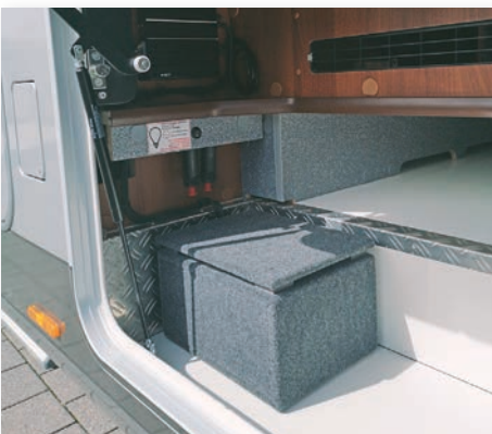
»17005« Subwoofer platzsparend installiert (im Gepäckraum / Doppelboden)