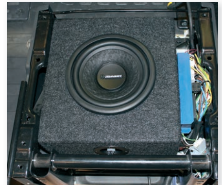
»17014« Subwoofer unter dem Sitz im Fiat Ducato (Sitzkonsole unter Beifahrersitz)