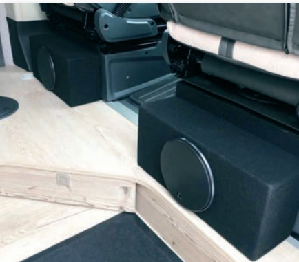
»17027-M« Subwoofer Magnetic hinter dem Beifahrersitz