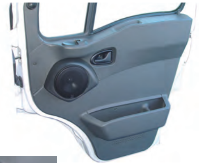
Daily III, ab Bj. 2006 Tieftön-Modul Türverkleidung

Belastbarkeit Dauer / Musik: 2x 80 / 160 Watt Übertragungsbereich: 55 - 22.000 Hz Impedanz: 4 Ohm empf. Verstärkerleistung: ab 2 x 70 - 150 Watt @ 4 Ohm