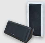
2x Multibox nach Wahl