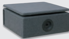
Subwoofer nach Wahl