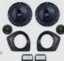
IVECO III Frontsystem 35103