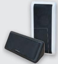
2x Multibox nach Wahl