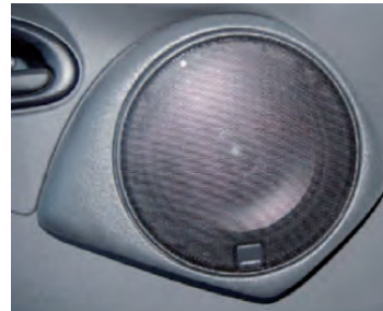
Tieftöner in der Fahrzeugtüre IVECO III mit Lautsprecher-Abdeckung