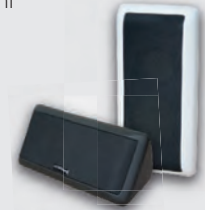
2x Multibox nach Wahl