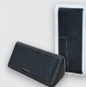
2x Multibox nach Wahl