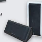
2x Multibox nach Wahl