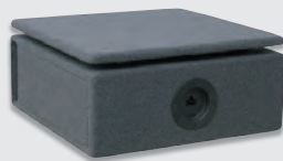
Subwoofer nach Wahl