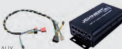
4-Kanal Verstärker AMP V40